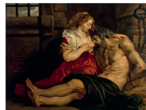
Рубенс, «Отцелюбие римлянки». Примерно 1612